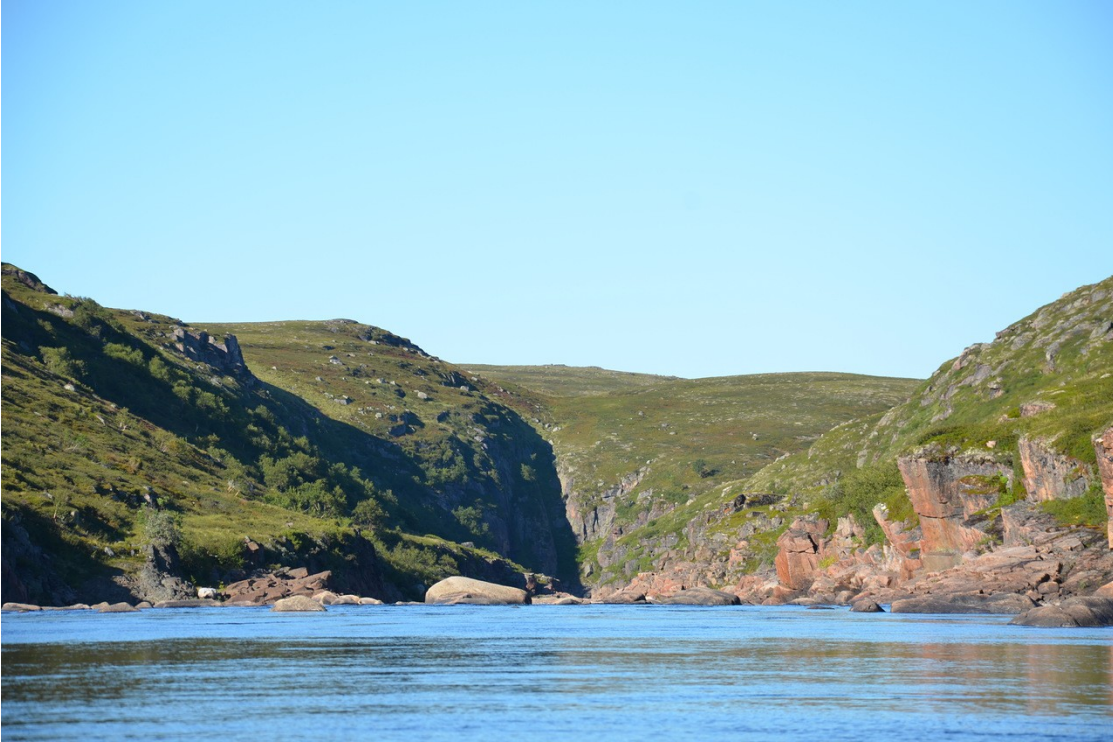
Фото 14. Ориентир порога «Стена каньона» — отвесные стены.

Перед порогом река входит в каньон, упирается в стену и делает резкий поворот направо. На повороте прижимает к скале. За поворотом основная ступень — пологий слив с противотоком. Бочка небольшая и пробивается легко. За сливом находится улово. Чалка на правом берегу перед поворотом.