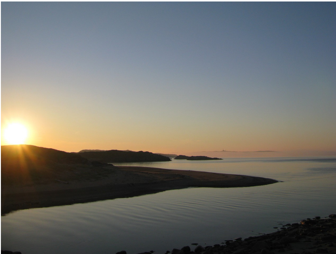
Фото 23. Устье реки Олёнка. Вдалеке виден погранпост на острове Бол. Олений.

Здесь к нам подошла охрана реки. Двое парней просили переместиться в соседнюю бухту, поскольку вблизи РПУ стоять не разрешается. Но потом они отошли, и мы спокойно переночевали на песчаном пляже.