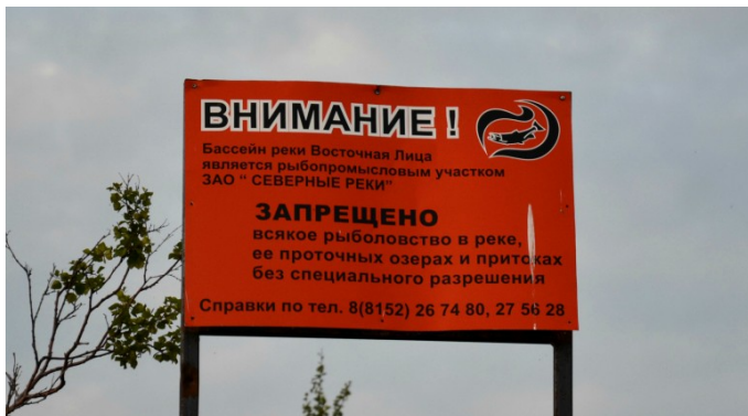
Фото 9. Информационный щит у истока Вост. Лицы на оз. Спасительны-Ты.

Перекаты в верхнем течении — единственное место на Лице, где можно вдоволь порыбачить. Дальше река, скорее всего, тоже богата рыбой, но исток озера Спа- сительны-Ты предвещает информационный щит запрещающий рыболовство.