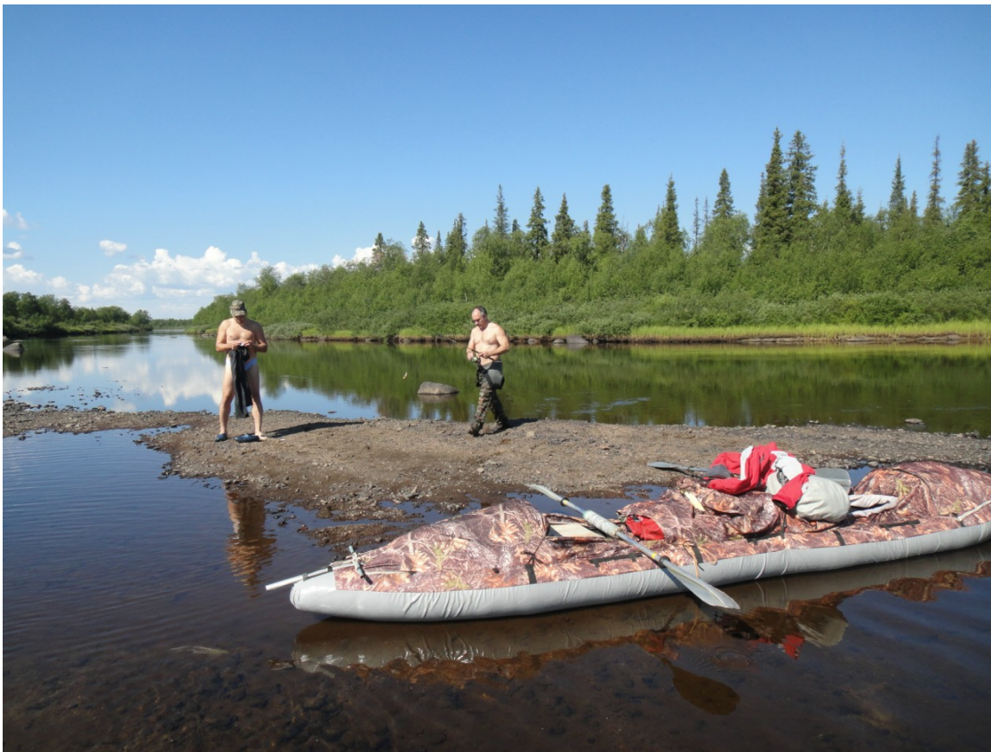
Фото 1. Стапель на Курге.

Казанка перевезла через Ловозеро и зашла в устье Курги. Здесь пришлось часто соскакивать и идти рядом по мелководью. По Курге понеслись с ветерком и доехали до двух островов. Дальше ехать было невозможно — путь преградил «порог», как назвал его хозяин казанки. Всего от села проехали 18 км за пару часов.