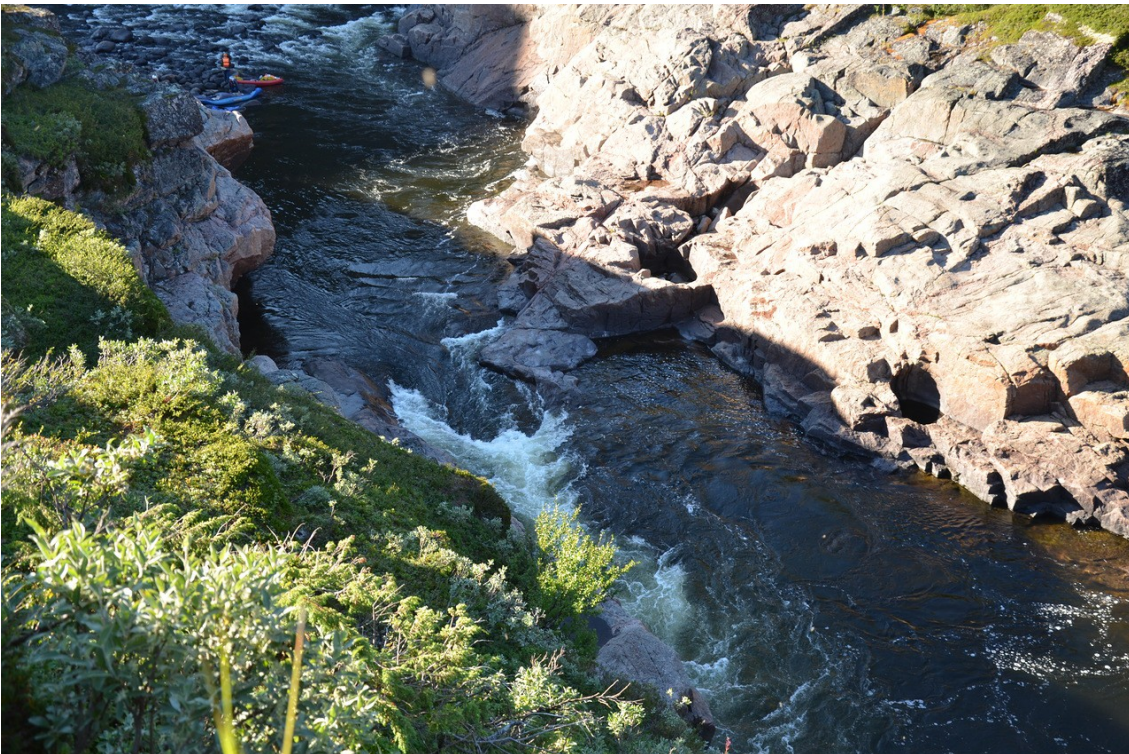
Фото 15. Правый поворот и основная ступень порога «Стена каньона».

Перед порогом река входит в каньон, упирается в стену и делает резкий поворот направо. На повороте прижимает к скале. За поворотом основная ступень — пологий слив с противотоком. Бочка небольшая и пробивается легко. За сливом находится улово. Чалка на правом берегу перед поворотом.