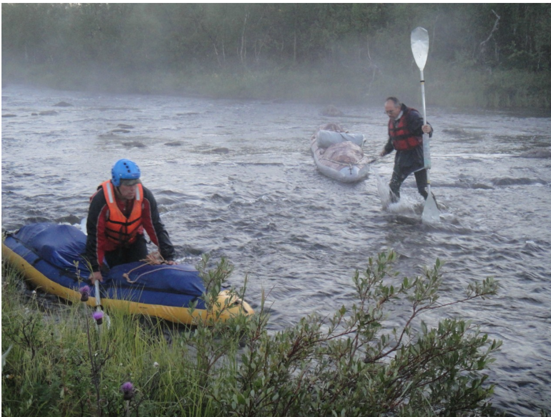
Фото 7. Протока перед Поросозером.

Выбор места ночевки между ручьев стал тактической ошибкой. Местность вокруг оказалась заболоченной, что затруднило начало следующего волока. Кроме того, мы оказались в виду дома, и собака лаяла, пока мы не улеглись в палатки. Лучше было встать за вторым ручьем или в следующей бухте, где мы бы не причинили столько беспокойства хозяевам неугомонной собаки.