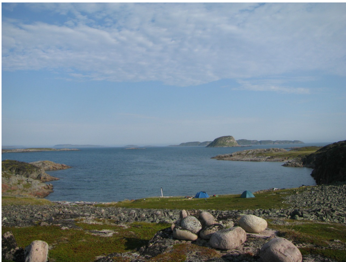
Фото 20. Вид на заповедник «Семь островов». Ближе расположен остров Кувшин.

Вечер застал посреди заповедника «Семь островов» в удобной песчаной бухте неподалеку от острова Кувшин. Этот остров — пирамидальная скала, с одной стороны отвесная, с других более пологая. По отвесной части сверху вниз шли какие-то белые полосы, издали походившие на блестящие струи воды. Возможно, это были следы птичьего помета, годами накапливающегося под гнездами.