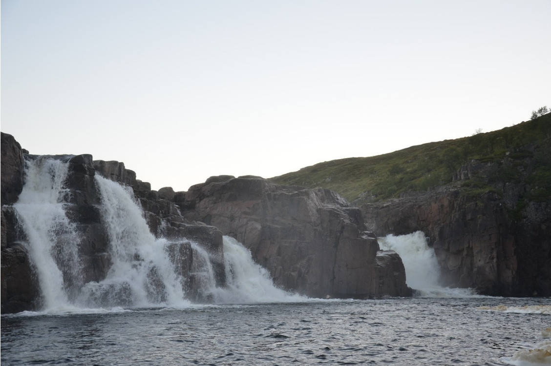
Фото 17. Водопад снизу.

Водопад обносится по правому берегу. Волок длиной 100 м. Берег высокий, уступами. При желании на уступах можно поставить две-три палатки. В конце обноса спуск по скользкой тропе высотой 7 м. Лодки и вещи желательно страховать от срыва веревкой.