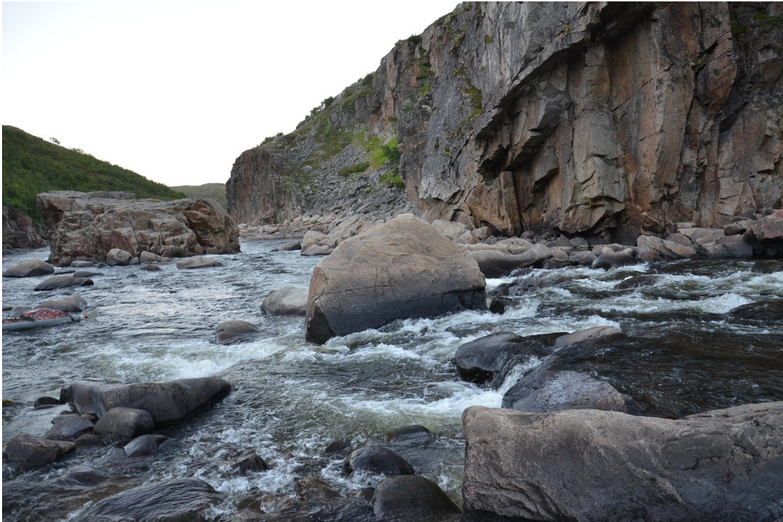
Фото 18. Порог «Восьмерка».

В километре ниже находится порог «Горка». Это слив длиной 10 м и высотой 2 м. За сливом язык быстротока длиной 20 м. Ориентиром служит крутой правый поворот почти на 180°. Перед ним чалка на правом берегу. Осмотр обязателен.