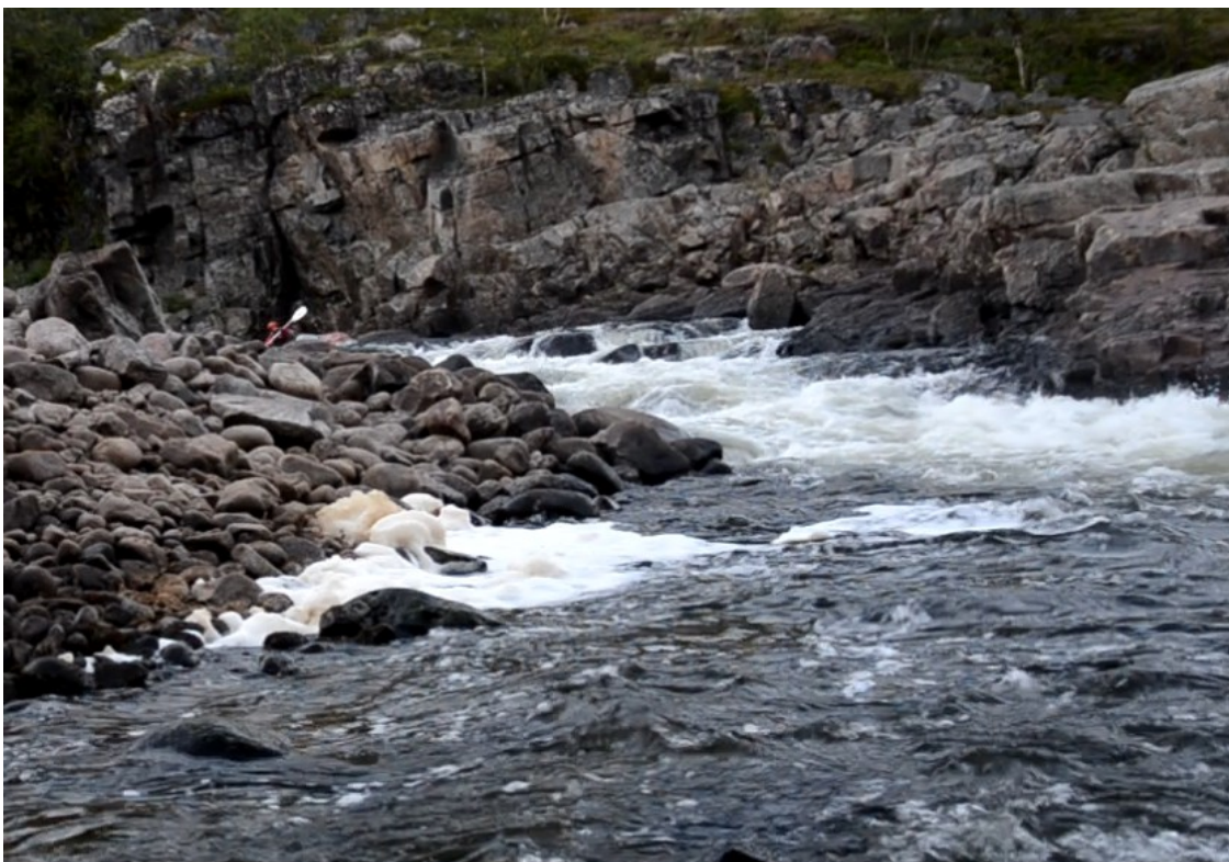
Фото 19. Порог «Горка».

В километре ниже находится порог «Горка». Это слив длиной 10 м и высотой 2 м. За сливом язык быстротока длиной 20 м. Ориентиром служит крутой правый поворот почти на 180°. Перед ним чалка на правом берегу. Осмотр обязателен.