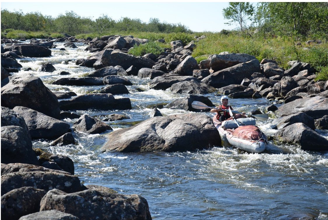
Фото 10. Порог 2 категории перед оз. Восточная Лица.

За озером Спасительны-Ты начинается порожистый участок протяженностью 36 км. Заканчивается он за 3 км до реки Пина. Средний уклон 1.6 метра на километр. Встречаются препятствия второй категории. Такими являются пороги и шиверы между безымянными озерами, перед оз. Восточная Лица и после него.