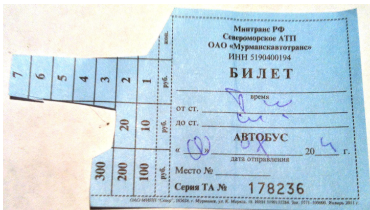
Фото 25. Билет на автобус Териберка — Мурманск по цене 327 руб.

Автобус приезжает в Териберку раз в два дня. Водитель ночует в Лодейном и на следующий день в шесть утра забирает пассажиров из обеих Териберок. Билеты покупаются на входе в автобус, причем стоимость проезда водитель вырезает ножницами на билете.