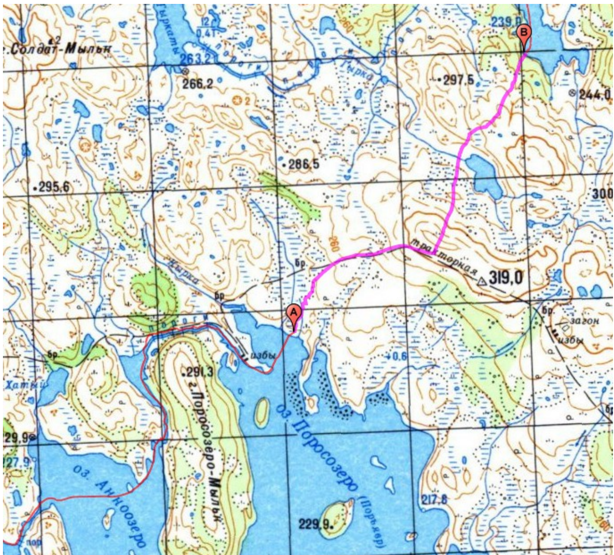
Фото 8. Волок на Восточную Лицу.

Часть волка проходила по вездеходной дороге. Она отчетливо видна на спутниковых снимках — словно федеральная трасса. Дорога поднимается на сопку, отмеченную высотой 319.