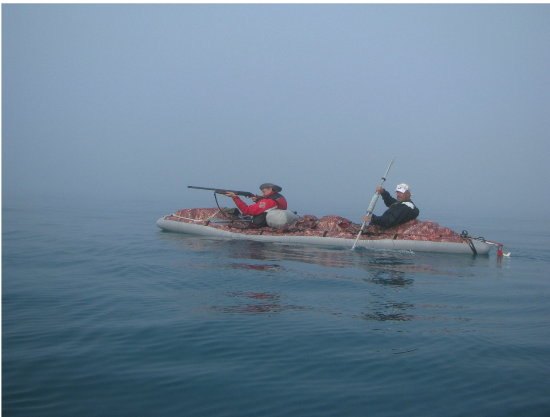
Фото 21. Туманная охота.

Незаметно прошли Харловку. Закинутые дорожки ничего не давали, и как только покинули заповедник, я достал свою блесну 12-го калибра. Охота принесла больше результатов. Три утки — две мелкие, одна крупная — лежали на деке.