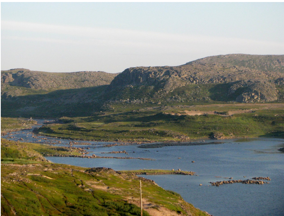
Фото 22. Долина и устье реки Олёнка.

К концу дня остановились в устье реки Олёнка. Очень живописное место.