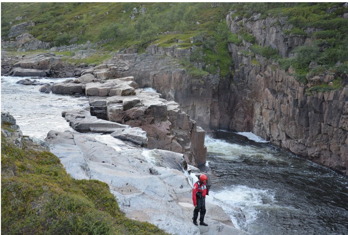
Фото 16. Водопад в начале каньона.

С воды водопад не заметен и даже не слышен. От ЛЭП до него 400 м, поэтому достаточно места для чалки на правом берегу. Ради безопасности лучше пристать под ЛЭП и пойти на осмотр. По пути можно выбрать место ближе к водопаду и затем перегнать лодки.