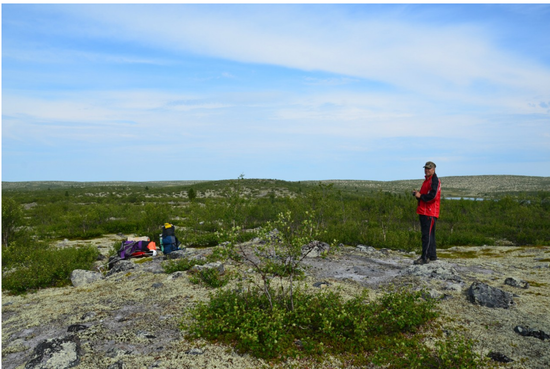
Фото 6. На волоке.

Переброска с озера Верх. Ленъявр началась в 14:25. Упакованные лодки и вещи за одну ходку перенесли на серпообразное озеро. Там собрали лодки и пересекли озеро на северо-восток. В заключении принесли собранные лодки на Янозеро. Закончили в 19:05.