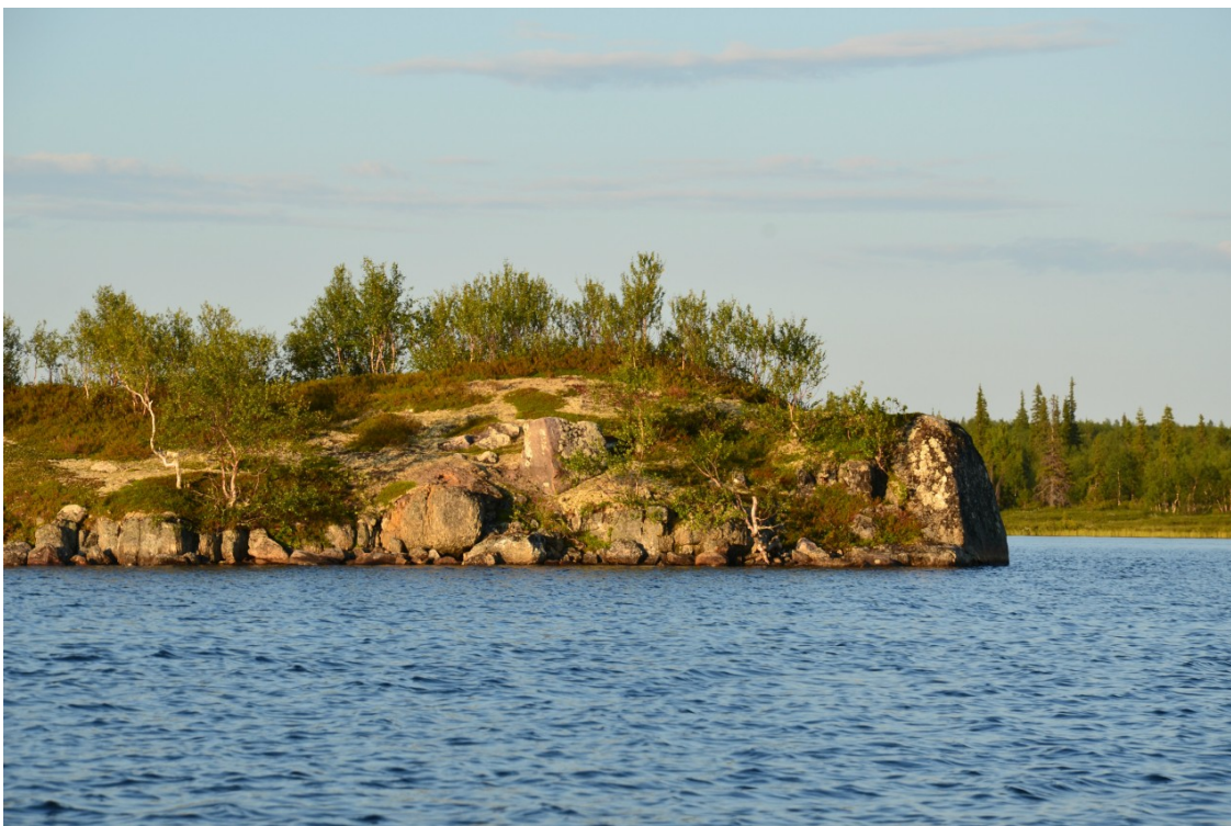
Фото 4. Скала на оз. Средний Ленъявр.

На правом берегу озера Средний Ленъявр хорошо заметная скала высотой до 4 м. Ее нужно обойти слева и продолжить подъем по ручью, который вскоре сужается и углубляется.