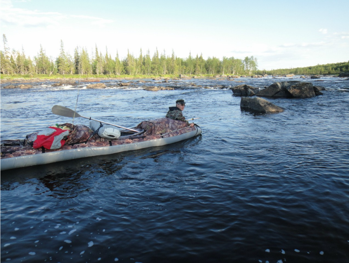
Фото 2. Подъем по Курге.

На Яловом озере много мест для стоянок. Одним из них воспользовался упомянутый турист-одиночка. Он пригласил встать рядом, но мы сообщили о желании дойти до Ефимозера. Коллега удивился, поскольку в его размеренном темпе подъем на Ефимозеро занимает три-четыре дня.