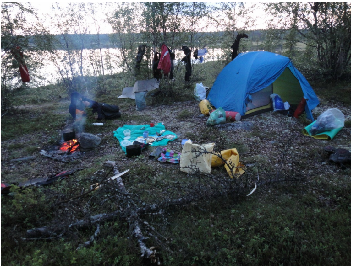
Фото 3. Стоянка на оз. Муйман.

Озеро Муйман — длинный плес, в начале которого на правом берегу хорошая стоянка. На ней мы заночевали, не дойдя до Ефимозера шесть километров.