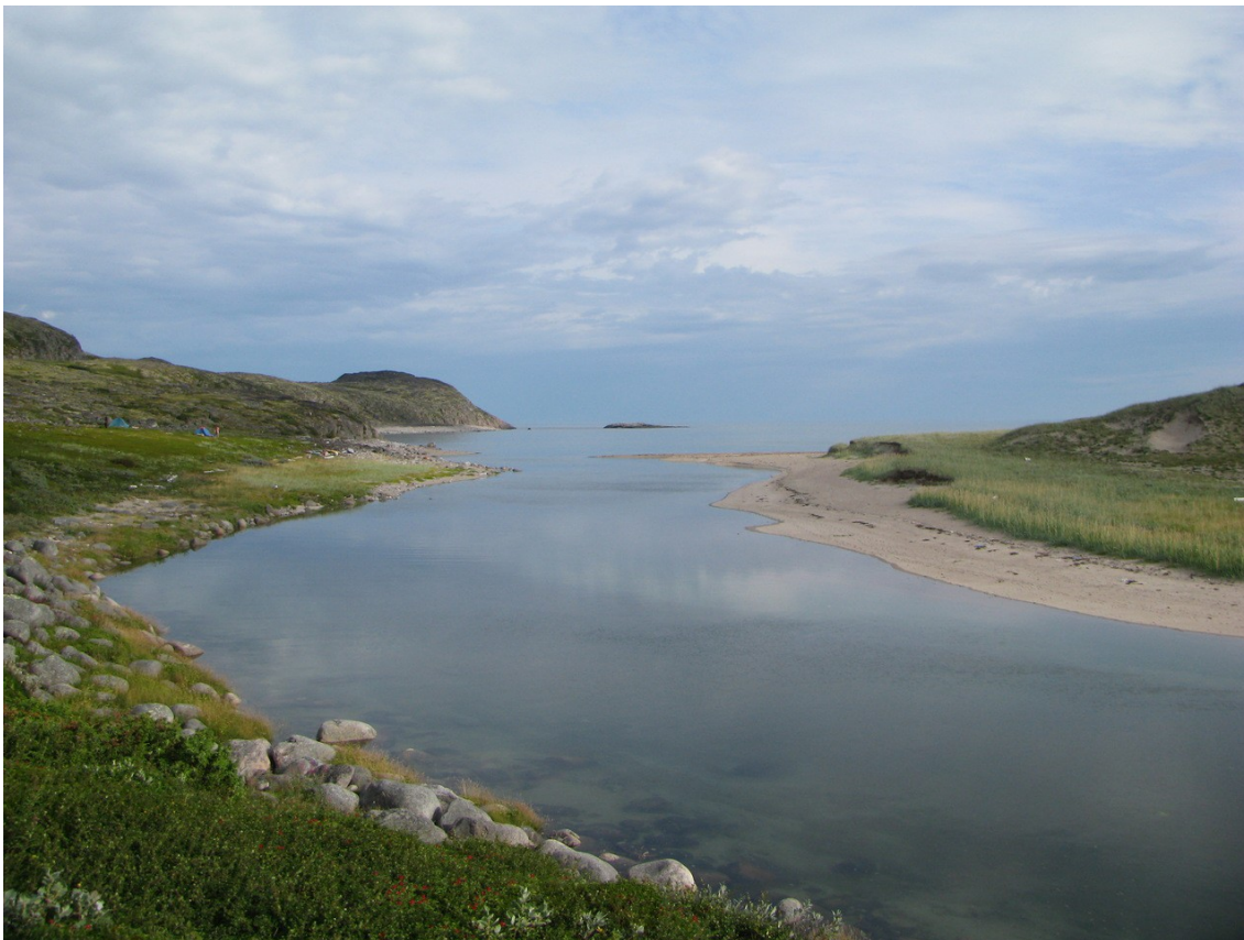
Фото 24. Устье ручья Федоровский при полной воде.

Мы нагулялись, потом пообедали. Потом прилив сменился благоприятным отливом, а мне все не хотелось идти в море, но уже по другой причине. В воздухе ощущалось ухудшение погоды.