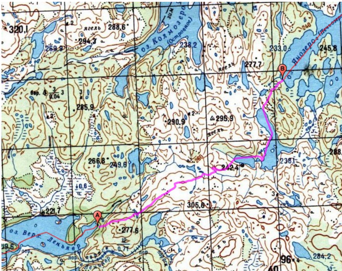
Фото 5. Переброска на Йоканьгу через безымянное озеро (т. А — т. В).

Задачей дня было перекинуться на Йоканьгу и прийти на Поросозеро к месту следующего волока. Имеются два варианта — волок на Колмозеро (ССВ) и волок на Янозеро (СВ). Первое озеро находится выше по течению Йоканьги, второе — ниже. Мы пошли по второму пути, показанному на карте.