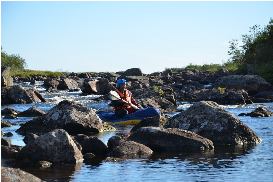
Фото 11. Участок порога после оз. Восточная Лица.

Малый расход воды и невысокая скорость течения делают прохождение не опасным в межень. Трудность связана с обилием камней в русле и частым протаскиванием байдарки по мелям.